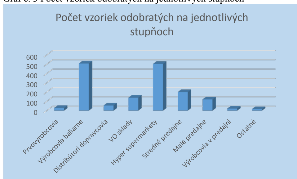
Graf č. 3 Počet vzoriek odobratých na jednotlivých stupňoch